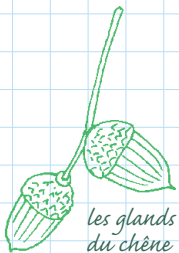
les glands du chêne pédonculé

Voici les glands des deux sortes de chênes de la forêt. Observe les dessins, relis le texte, et tu pourras les reconnaître sans problème pendant la balade.