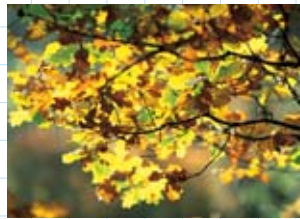
le feuillage des chênes